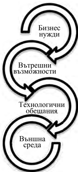
Схема 2. Опорни точки за вземане на решения за необходимост от цифровизация

Промените в механизмите за вземане на решения, обусловени от новите тенденции в търсенето на клиенти и нарастващата конкуренция, могат да бъдат основни причини за нуждата от дигитализация на компанията. В ситуации, когато дадена технология има основополагаща роля, цифровизацията обикновено се случва отдолу нагоре, като е фокусирана върху специфичните цели на компанията, предопределени от промени в управлението на процесите и операциите, организационните структури и механизмите за вземане на решения. Пример за това от финансовата сфера е едновременното развитие на онлайн банкирането и приложения за моментален трансфер на пари. Банките, които са се забавили със съвременното внедряване на такива платформи, губят активен пазарен дял. Внедряването на такива доминиращи по значение функции се случва отгоре надолу, тъй като забавянето или липсата им може да се окаже фатална за компаниите. Когато влиянието на пазара е по-значително, целият процес на дигитализация започва от промени и вземане на решения на корпоративно ниво, които впоследствие се придвижват по стълбицата на йерархията (Филева, 2013, с. 124-129).