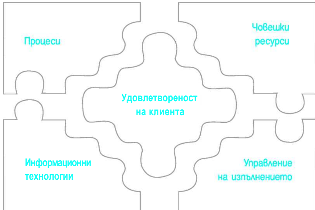
Фигура 3 Основни организационни елементи

Оптимизирането на тези организационни елементи следва да бъде направено с фокус върху потребностите на клиентите и да цели постигане на тяхната удовлетвореност от обслу>кването.